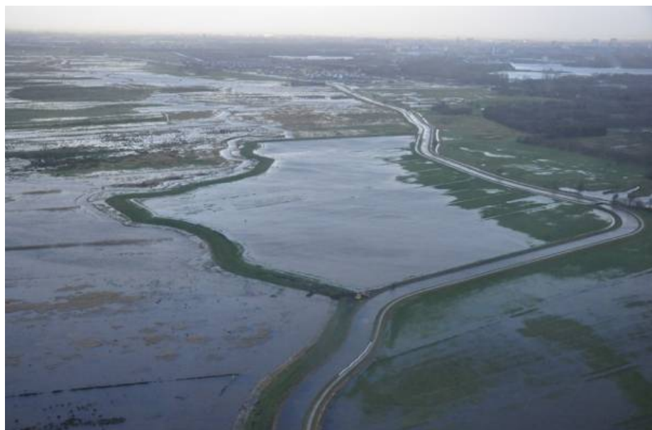
Het gebied één dag na het besluit het in gebruik te nemen voor waterberging (5 januari 2012).