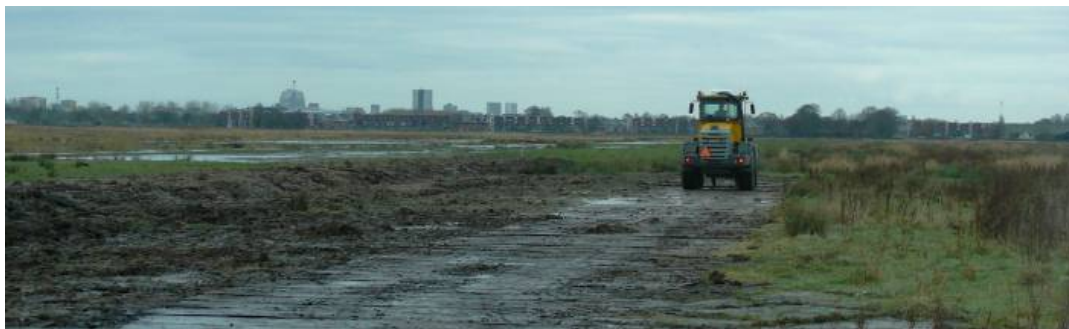
Werkzaamheden aan de Eelder en Peizermaden, met Groningen op de achtergrond

Het klimaatbufferproject Eelder en Peizermaden (als onderdeel van de herinrichting) heeft de volgende doelen: