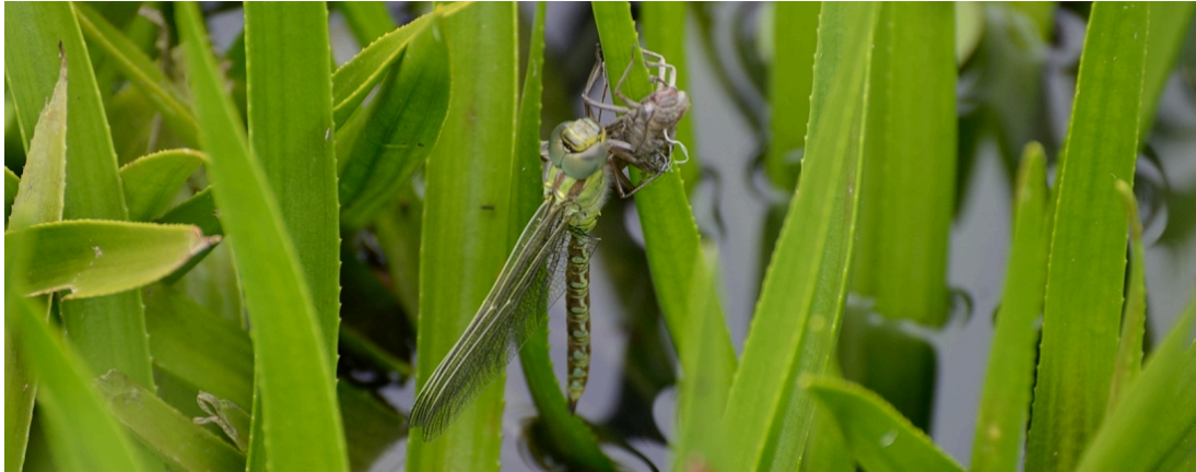
Groene glazenmaker, uitsluitend op krabbenscheer

broedvogels, dagvlinders, sprinkhanen, libellen) vindt plaats in het kader het Subsiestelsel Natuur en Landschap (SNL).